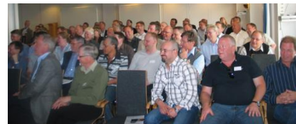
SPFs vårkonferenser är populära och har de senaste åren dragit över 100 deltagare.

SPF, Svensk Pulverlackteknisk Förening, har som främsta uppgift att stärka pulverlackens ställning i Sverige. Genom att vara med i SPF hjälper du till med detta.