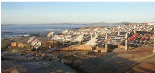
Utvärdering av pulverlackers korrosionsskydd gjordes bl a på Bohus Malmön.